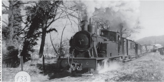
AEGAX. Construcció d'Imatges de Joan M. Dou Camps

L'any passat en va fer cinquanta que el tren Olot-Girona fou tret de la circulació, quan el qui subscriu era regidor de l'Ajuntament d'Olot, la qual cosa em va permetre seguir algunes facècies del com i el perquè es va produir el malaventurat final. El meu relat és el d'una vivència personal; els interessats en dades concretes les trobaran en la paperassa oficial. L'explotació del tren, en mans de la Companyia del Ferrocarril d'Olot a Girona, anava de mal borràs i per treure-la de l'ensulsiada se'n feu càrrec FEVE, una companyia ferroviària pública, dependent del Ministeri de Foment, que explotava les línies de tren d'un ample de via inferior a l'"ample ibèric". L'objectiu era redreçar la situació o procedir al tancament.