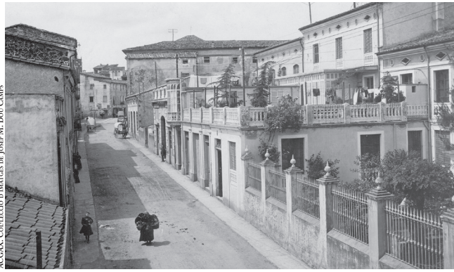
ACCA. COLECCIÓN D'IMATGES DE JOAN M. DOR CUMIS

Em fou proposat, per la direcció d'aquest Cartipàs , que redactés uns articles sobre les meves vivències, amb els meus dubtes sobre a qui poden interessar. És una proposta arriscada, perquè les vivències es basen en la memòria personal, que sempre és subjectiva. Si a això hi afegim el pas dels anys, que actua com un filtre sobre els records, com una boira involuntàriament interessada, arribo a la conclusió que he d'admetre d'antuvi que molts lectors tinguin percepcions diferents sobre les vivències que puc explicar, i pot ser que tinguin raó.